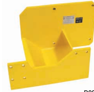
D08-400 Motor adaptör MAN D08 serisi