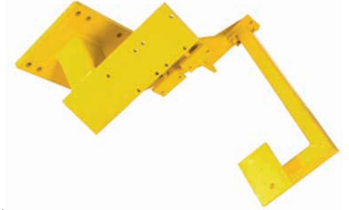
D28-1000 Motor adaptör MAN D28 serisi