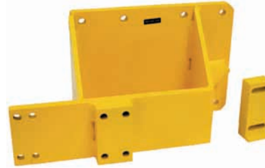
D28-550 Motor adaptör MAN D28 serisi