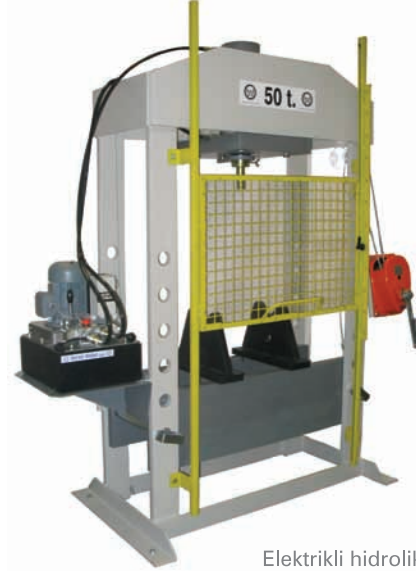
Elektrikli hidrolik güç ünitesi versiyon