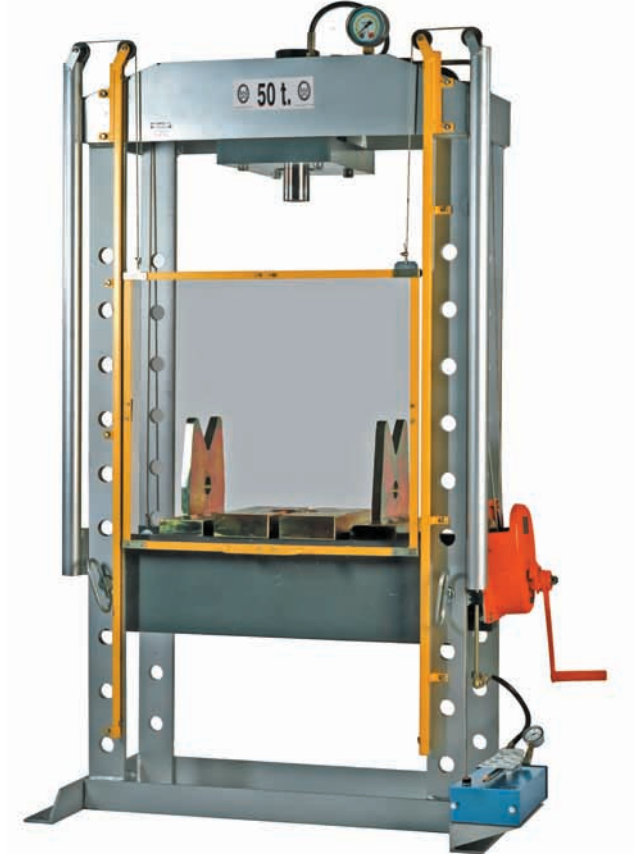
Havalı hidrolik ayak pompalı versiyon